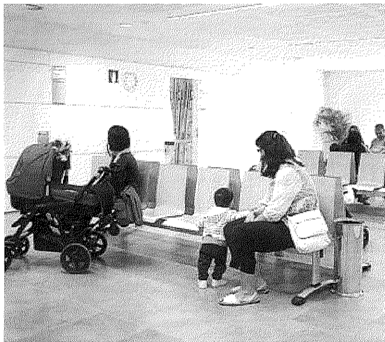
Varios niños y sus padres esperan al pediatra.

En cuanto a las urgencias en las zonas urbanas cabe destacar que se van a mantener como en la actualidad. Así, para el área de Pamplona desde las 15.00 horas hasta las 8 h. habrá actividad de urgencias en el ambulatorio San Martín (todo el día en festivos y fin de semana) mientras que en los centros de Burlada y Rochapea y Ermitagaña será de 15.00 horas a 20.00 horas. En Tafalla, Estella y Tudela será en los centros de urgencias de 15.00 a 8 los laborables y todo el día en festivos.